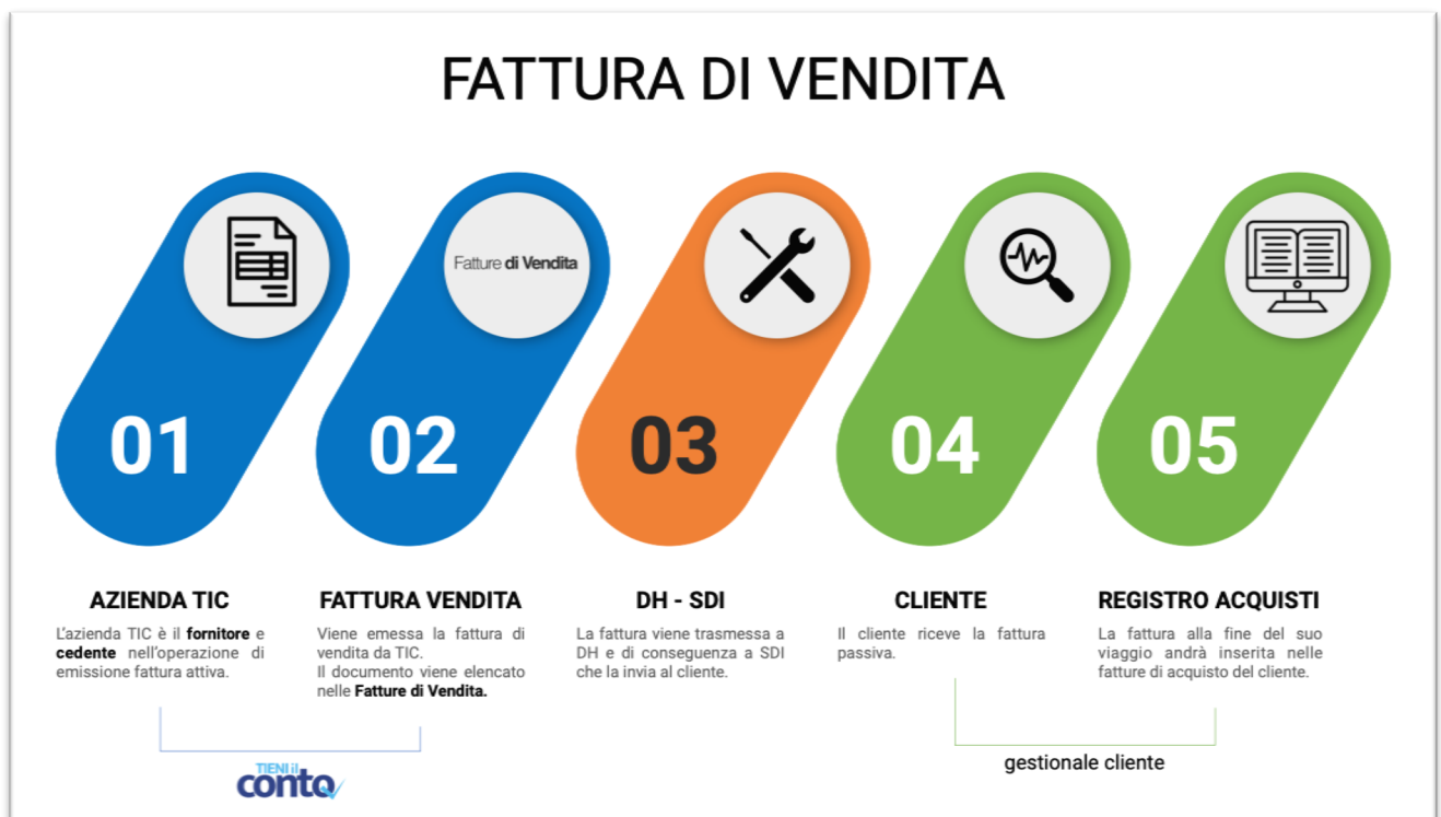
Figura 1 Esempio di flusso di fattura di vendita

L'emissione di Fatture di vendita prevede un flusso "classico" come indicato in figura 1.