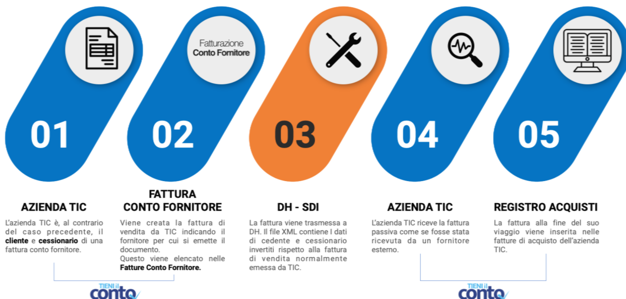
Figura 2 Esempio di flusso di Fattura Conto Fornitore

Nel caso di emissione di Fattura Conto Fornitore (FCF), il ruolo di CEDENTE non è più dell'azienda TIC, ma del soggetto inserito in fase di creazione FCF.